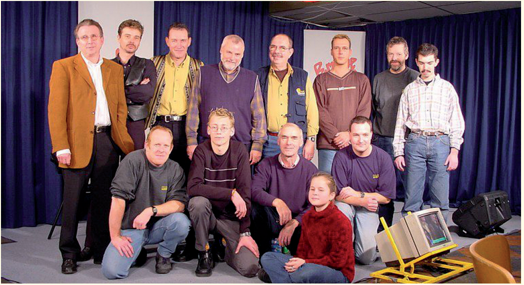
Medewerkers van de tv-talkshow Bombarie in 2001.