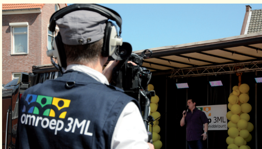
Presentatie van Omroep 3ML op de jaarmarkt in Heythuysen (foto 3ML).

De letters ML markeren het uitzendgebied van de omroep, namelijk de gemeenten Maasgouw en Leudal. Verder verwijst de afkorting naar de oude omroepen Studio Maasbracht en Omroep Leudal. ML verwijst tevens naar de belangrijke waterstromen in het werkgebied: de Maas en de Leubeek. Drie stilistische figuren vormen samen de boogvorm, de missie van de lokale omroep om mensen in de regio samen te brengen. De drie blokjes staan voor radio, tv (inclusief kabelkrant) en internet. De kleuren blauw, groen en geel staan voor water, bos en bedrijvigheid. De 3 geeft de lokale gelaagdheid aan waarbinnen de publieke omroep 3ML opereert (is laag 3), dus onder de landelijke (is laag 1) en de provinciale (is laag 2) publieke omroepen.