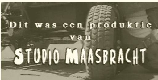
Aftiteling van een film uit 1999 over de toegankelijkheid van gebouwen in Maasbracht voor gehandicapten.

De drie gemeenten Heel, Maasbracht en Thorn vormden per 1 januari 2007 samen de nieuwe gemeente Maasgouw. In Heel en Thorn had Omroep Leudal sinds 1998 een uitzendvergunning. Studio Maasbracht was actief in Linne, Maasbracht, Maasbracht-Beek, Ohé en Laak en Stevensweert. Aangezien een groter uitzendgebied vele voordelen had, was het besluit met Studio Maasbracht te fuseren snel genomen.