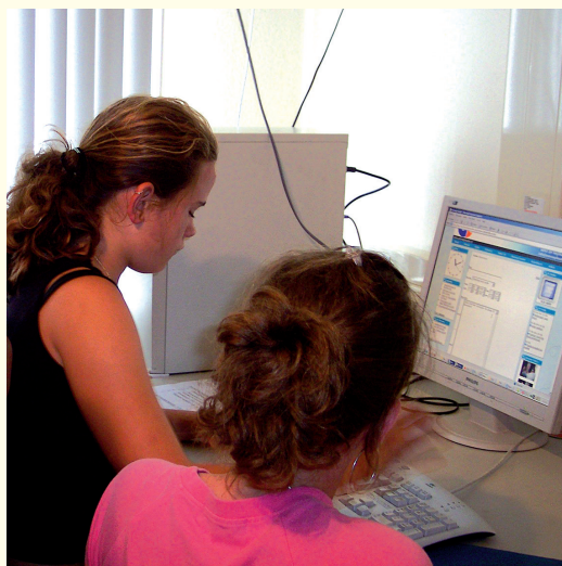
Leerlingen plaatsen onderstaand bericht op tekst-tv.

Er werd ook gewerkt aan (naams)bekendheid en regelmatig waren er bezoekers in de studio voor een radioprogramma of een rondleiding. In het kader van de schoolverlatersdagen bezochten leerlingen van groep 8 van Basisschool De Beukenhof uit Heythuysen eind juni 2007 de studio. Ze waren daarbij actief bezig met televisie, radio en tekst-tv.