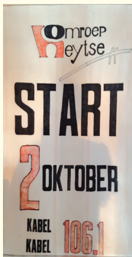
Banner bij de ingang van de studio bij de eerste radio-uitzending.

dat hij mogelijk na de herindeling een goed aanspreekpunt bij de gemeentelijke instanties zou kunnen zijn. Om zich breed te oriënteren bezocht het bestuur vervolgens een aantal lokale omroepen. De lokale omroep Someren kwam toen erg goed uit de bus. Na ruim twee jaar van voorbereiding vond op 2 oktober 1993 de eerste radio-uitzending plaats.