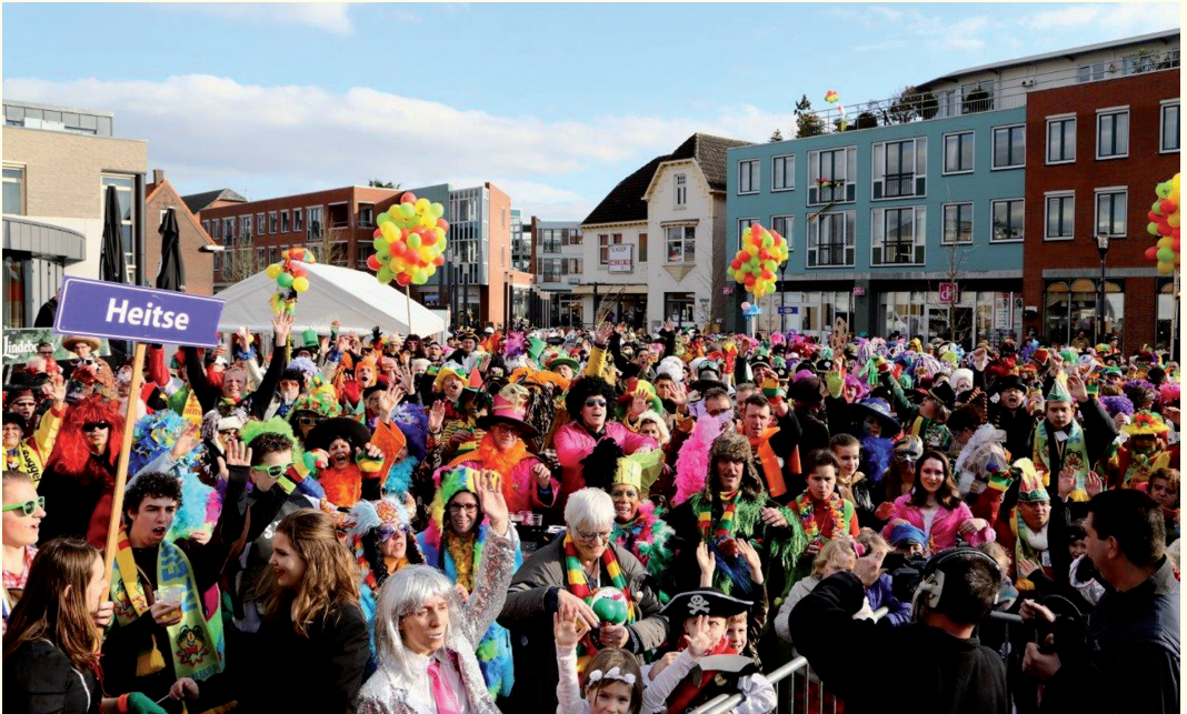
Het Lindeboom Vastelaoves Pleinfestijn in 2015.

Na ieder optreden werd met een applausmeter de waardering van het publiek gemeten. Ieder jaar kon het festijn op meer belangstelling rekenen; het was eveneens op 3ML-tv te zien. Op 22 februari 2020 beleefde het pleinfestijn de tiende editie met ruim 2500 bezoekers. Er waren geen lange wachtrijen, geen entree en geen polsbandjes. Vanwege de coronamaatregelen was er in 2021 geen live festijn. Op 13 februari was er wel op tv een samenvatting van tien jaar Pleinfestijn getiteld 't Plein hêltj ós biejein! In 2022 was vanwege corona op 19 februari 's avonds online 't Lindeboom Vastelaoves Quizfestijn , een quiz en een show met live entertainment door regionale artiesten.