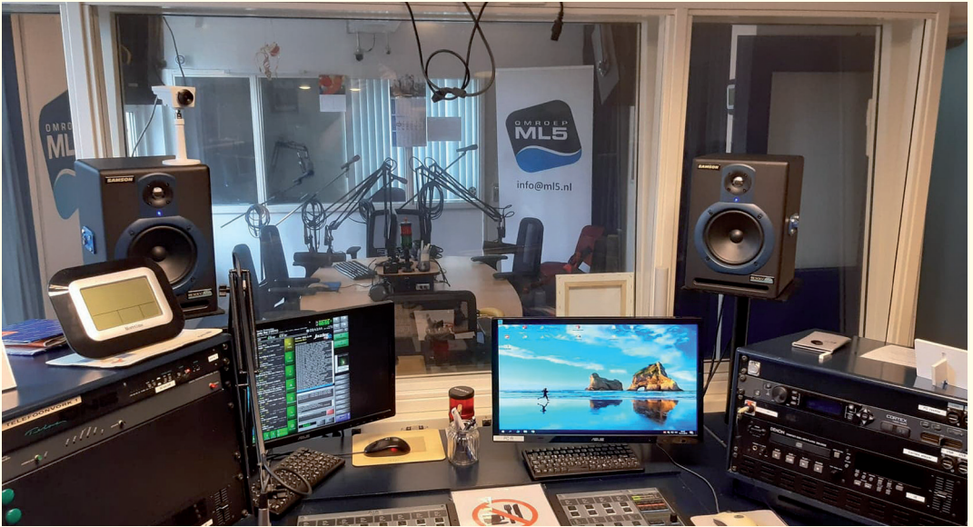
De vernieuwde radiostudio met op de achtergrond de presentatie- en gastentafel.

Ze werd hoofd tv bij ML5 en werd per 1 oktober 2022 tevens hoofdredacteur ad interim. Intussen was de samenwerking tussen ML5 en het Video Collectief intensiever geworden en in maart 2021 werd een samenwerkingsovereenkomst getekend.